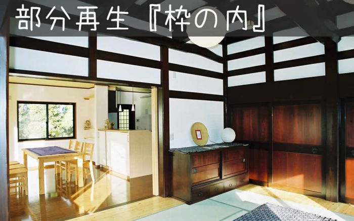
家族が集う空間へと生まれ変わった砺波市Y様邸